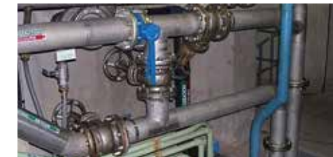
Armoires et tuyauteries industrielles, nos équipes assurent la maintenance dans tous les domaines de l'industrie.