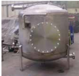
Structure métallique, brise verre, armoire et cuve en inox