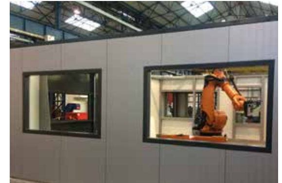
Pour l'industrie ou encore le bâtiment, après la fabrication, nos pièces sont montées sur site ou en atelier.